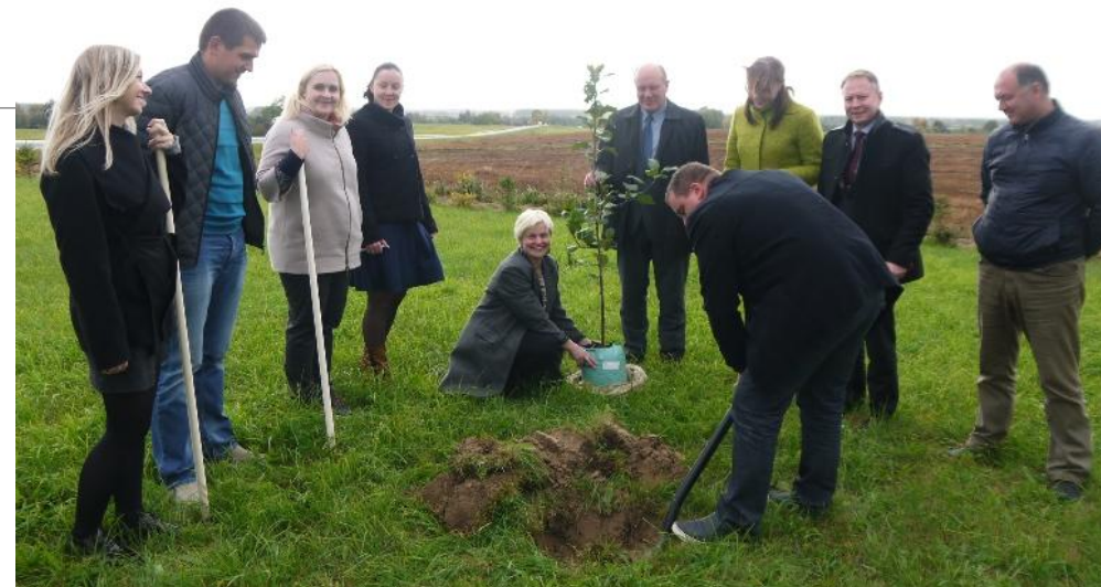
VVG obelis auga prie Struvės.

VIZIJA. Rokiškio r. kaimo vietovės taps patrauklesnės jame gyvenantiems ir atvykstantiems. Pagerėjus kaimo infrastruktūrai ir gyvenimo kokybei, stiprės ir plėtosis konkurencingi verslai. Vietos bendruomenės stiprins viešųjų paslaugų ir socialinių verslų plėtrą. Tradicijos, papročiai, kraštovaizdis, kultūros paveldas taps kaimo traukos objektais.