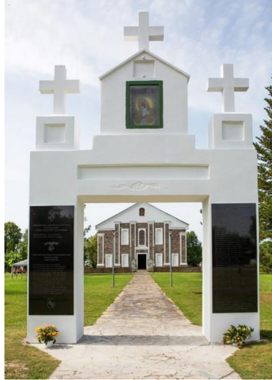
Kriaunų varpo projektas