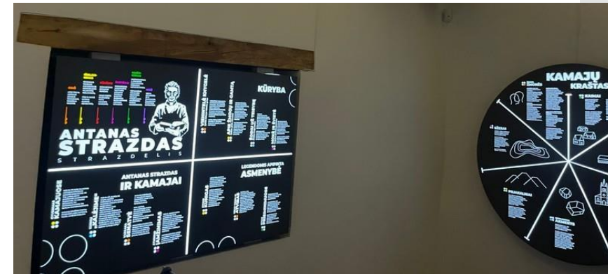
Kamajų Šv. Kazimiero koplyčioje poeto kun. Antano Strazdo muziejus