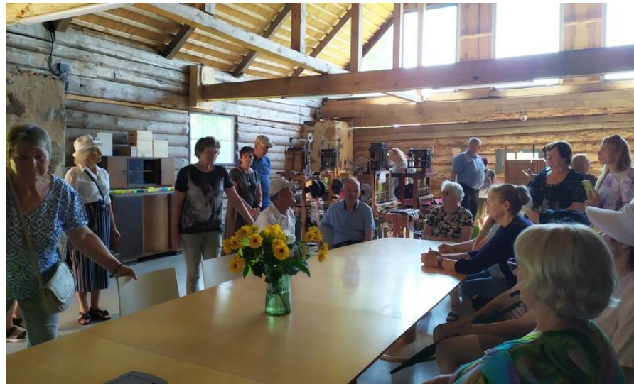
Dailininko Justino Vienožinskio sodybos klojime amatų erdvė